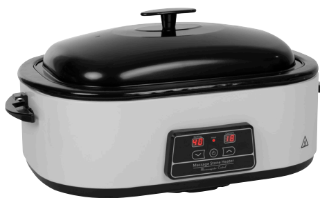
MSH 17-Serie (1200W)