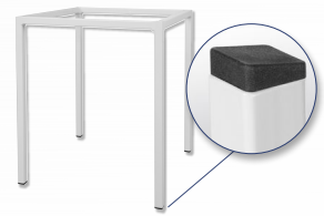
Gestell Standard Vierkantrohr