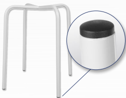
Gestell Standard Rundrohr