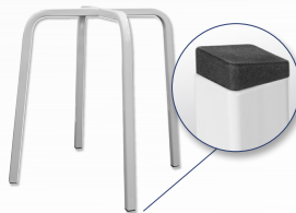
Gestell Exklusiv Vierkantrohr