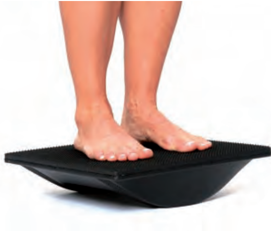
Frontalebene (Füße parallel zur Kipprichtung)