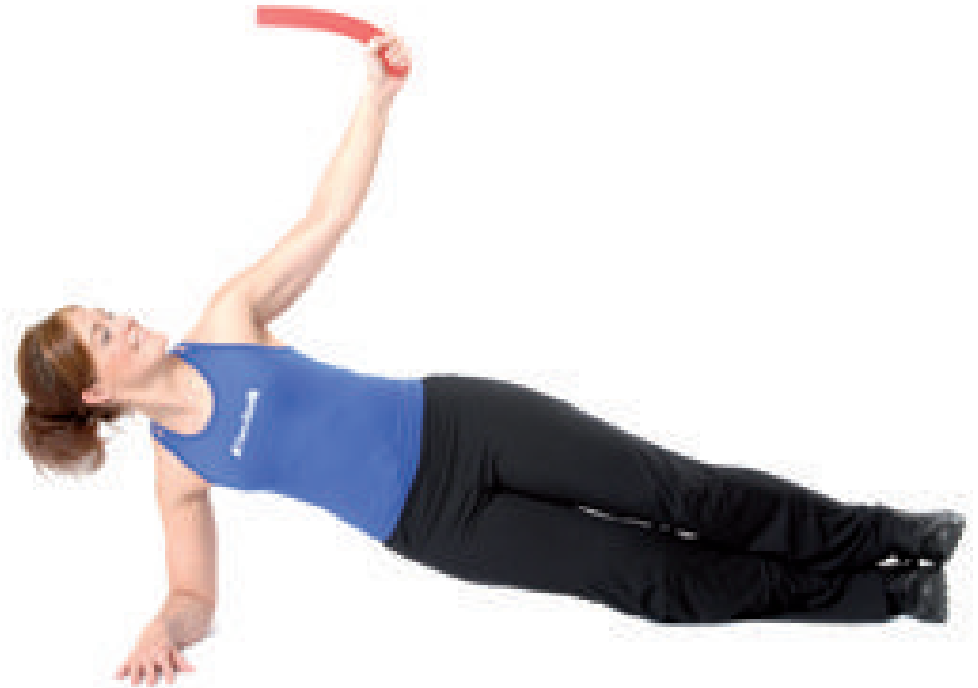
© Wie ©, aber mit Blick zum flexiblen Übungsstab.