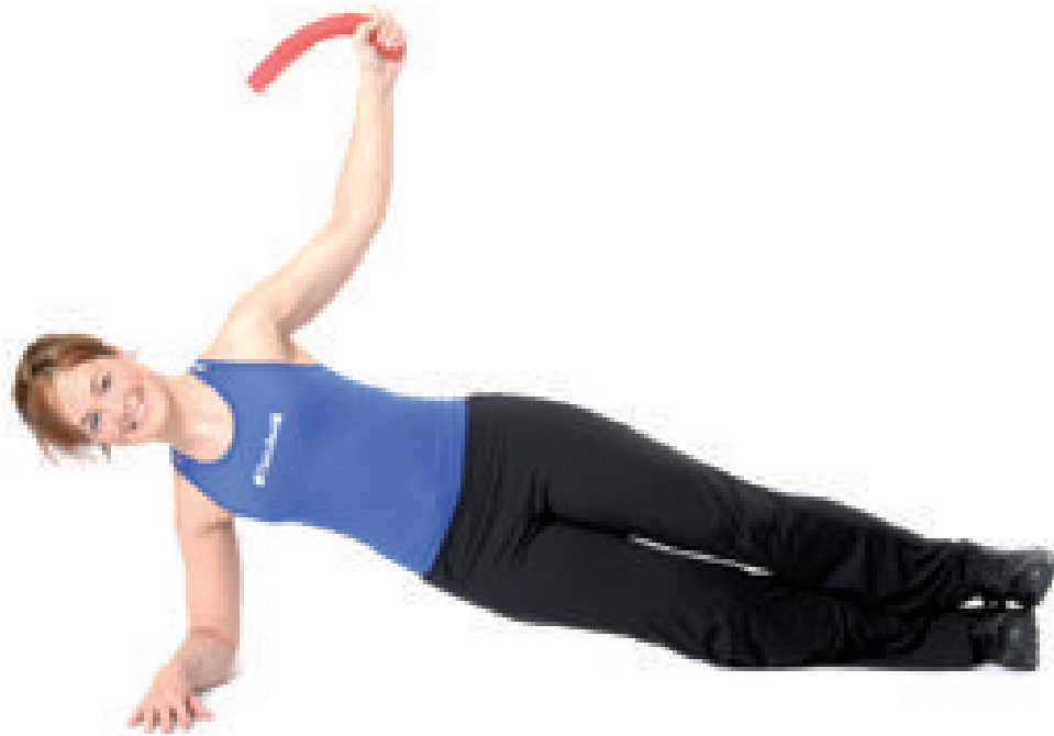
© Wie ©, aber mit gestreckten Beinen.